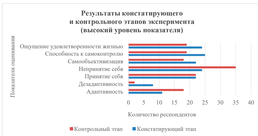
Рисунок 3. Результаты констатирующего и контрольного этапов эксперимента (высокий уровень показателя)

Результаты, приведённые в таблице 3 и диаграммах (Рис. 1-3), свидетельствуют о положительной динамике формирования социально-ориентированной личности при условии включения дополнительных учебных материалов в содержание обучения иностранным языкам, затрагивающих проблемы становления личности обучающихся, и применения методических и психолого-педагогических техник, адаптированных для естественного протекания учебного процесса.